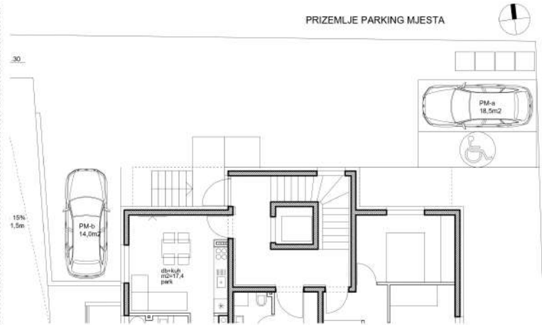
PRIZEMLJE PARKING MJESTA