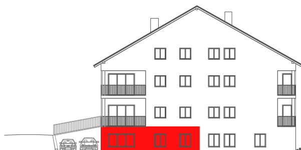
položaj stana na pročelju JUG