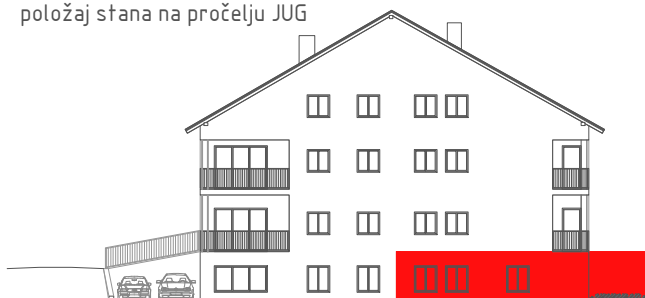
položaj stana na pročelju JUG