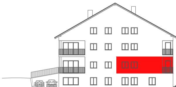
položaj stana na pročelju JUG