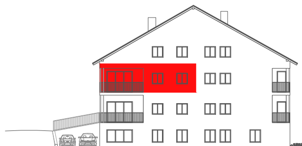
položaj stana na pročelju JUG