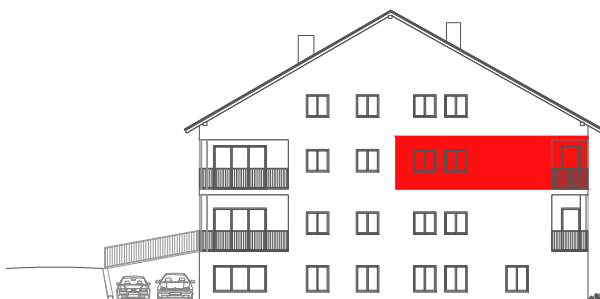
položaj stana na pročelju JUG