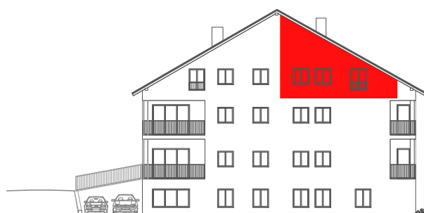
položaj stana na pročelju JUG